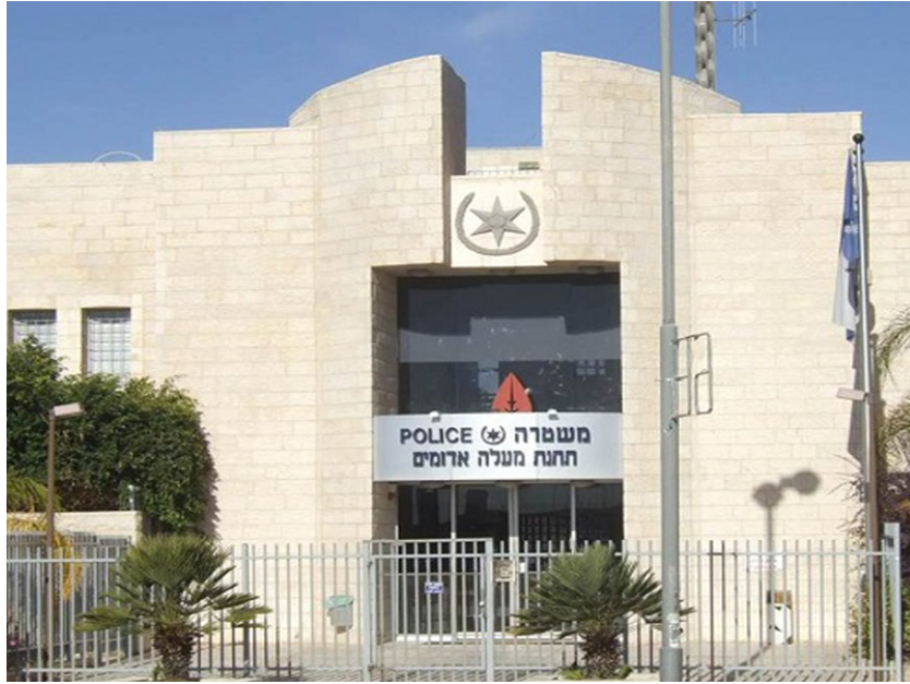
مركز الشرطة في معليه أدوميم أقيم بجزئه على أراضٍ فلسطينية بملكية خاصة وفي جزئه الآخر على أراضٍ فلسطينية جرى مصادرتها للأغراض العامة.

في الصفحات التالية تجدون جداول تلخص النتائج الأخيرة وبعدها صور جوية لكل من منشآت الشرطة في الضفة الغربية، مع ذكر نوع الملكية في كل موقع وآخر.