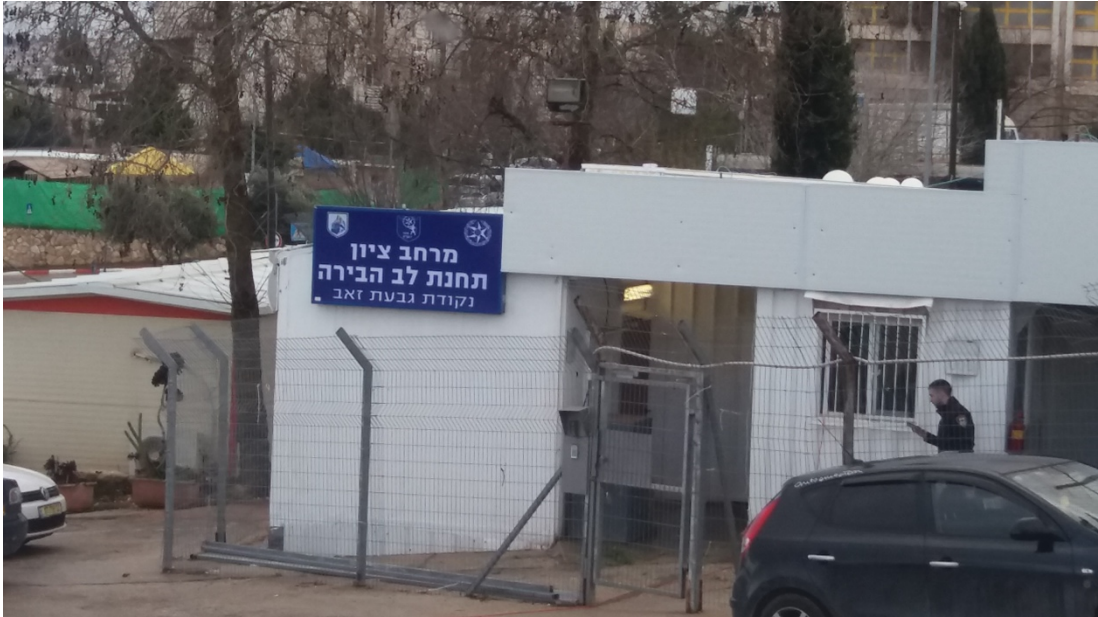
مركز الشرطة في جبعات زئيف أقيم بكامله على أراضٍ فلسطينية بملكية خاصة.

نذكر في هذا السياق أنه ومنذ العام 1997 يُعرّف الجيش مناطق المستوطنات بأنها "مناطق عسكرية مغلقة" أمام السكان الفلسطينيين، وكل دخول إلى المستوطنات يتطلب تصريح خاص 4 . وحقيقة وجود معظم مراكز الشرطة داخل المستوطنات، أو في مناطق بعيدة عن البلدات الفلسطينية، تشهد بنفسها على تصوّر شرطة إسرائيل لدورها في هذه المنطقة.